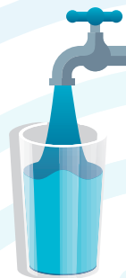
TABELA DE TARIFAS E PREÇOS 2022