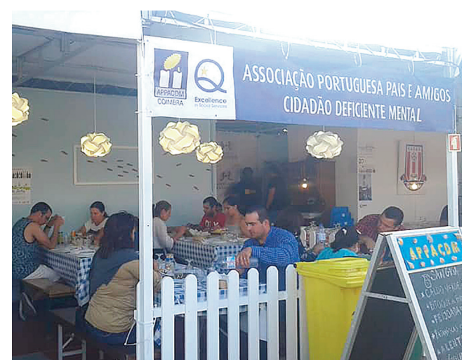
Tasquinha funcionou durante os 11 dias do evento de Cantanhede