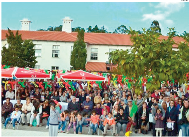
A confraternização conseguiu reunir "mais de 700 visitantes"

CONVÍVIO A Associação de Desenvolvimento Progresso e Vida da Tocha promoveu, «com grande sucesso», o III Arraial Solidário. Com «grande empenho e simpatia das funcionárias», a iniciativa decorreu nos jardins da instituição, recentemente requalificados, e proporcionou