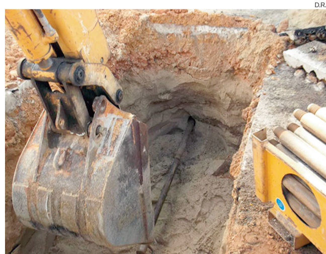
A resolução de problemas na rede assume-se como essencial

Unanimidade O executivo camarário aprovou o pedido de um empréstimo para investimentos "necessários e urgentes"