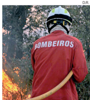
O objectivo da iniciativa é ajudar os bombeiros

A II Corrida e Caminhada Solidária vai desenrolar-se nos mesmos moldes da primeira edição. A caminhada terá um percurso de quatro quilómetros, com início às 17h30, depois do aquecimento com zumba, seguida da corrida às 18h30,