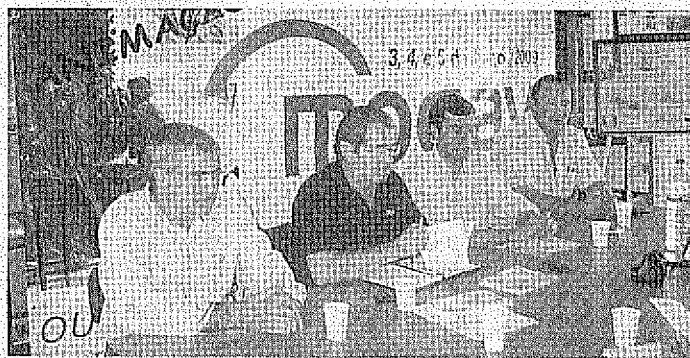
QUARTA EDIÇÃO da MOGAV foi apresentada na Junta de Freguesia de Vilamar